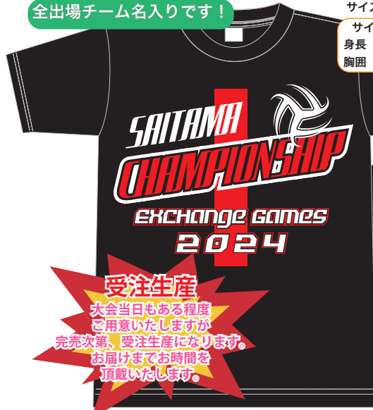
Tシャツ黒地 ホワイト/レッドプリント